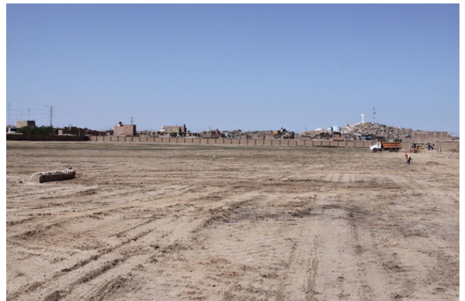
Figura 3: Terreno donde se construyó el Hospital Regional Lambayeque

Se menciona que en el año de 1975 la fundación Calixto Romero Hernández dona el terreno que serviría para la construcción del futuro hospital (3) . Esta fundación pertenece al reconocido grupo transnacional empresarial Romero. Durante muchos años este terreno permaneció esperando el anhelado sueño de la construcción del hospital (Figura 3).