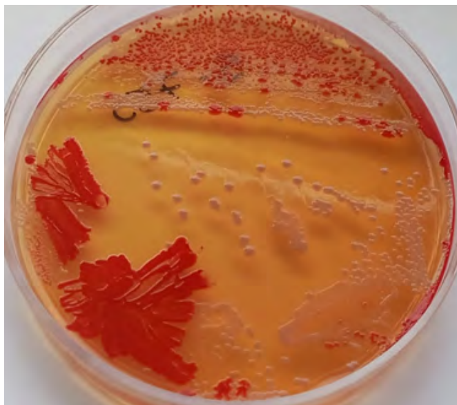
Figura 2. Crecimiento bacteriano mixto de colonias pigmentadas y lactosa negativas en agar Mac Conkey luego de 48h de incubación a 37°C a condiciones aerobias. Obtenida a partir de una muestra de aspirado traqueal procedente de un paciente de áreas críticas en el Hospital regional Lambayeque.

aspirado traqueal de aspecto mucoso y rojizo y volumen 15 mL procedente del servicio de áreas críticas UCI perteneciente a un paciente varón de 57 años, la orden indica tratamiento previo con carbapenemes y colistin por 5 días, según el registro es la primera vez que llega una muestra de origen respiratorio del paciente al servicio. Se procede a sembrar la muestra con ansa de 1 uL para la determinación cualitativa del agente causal bajo el método de siembra de agotamiento y estría en placas de agar Mac Conkey, sangre, chocolate y Sabouraud. La coloración gram indica la presencia de cocos gram negativos y bacilos ocasionales. Las placas inoculadas con la muestra