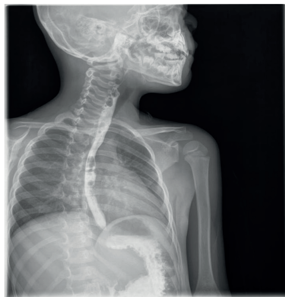
Figura 3. Esofagografía que revela un adecuado pasaje de la sustancia de contraste a través del esófago hasta el estómago.