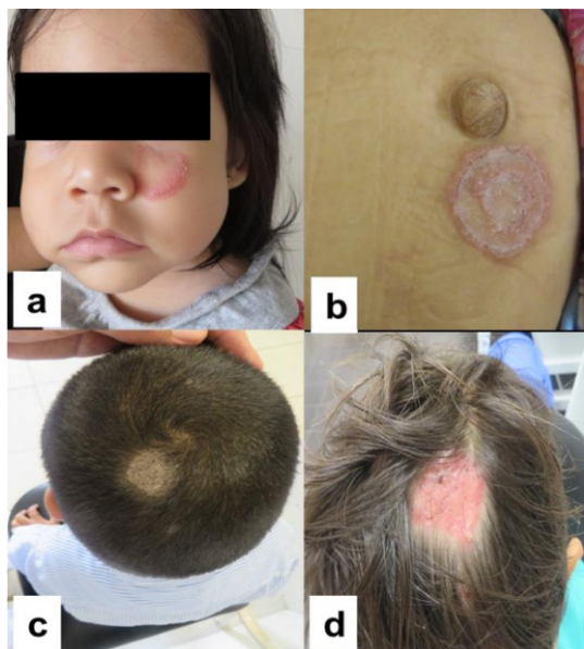
Figura 1: Micosis superficial causado por Microsporium canis : a y b) Tinea corporis; c y d) Tinea capitis.

Microsporium canis es una especie que afecta a estructuras queratinizadas por acción de su queratinasa causando dermatofitosis o tiña con claro tropismo de infectar a piel y pelo. Tiene como reservorio natural a perros y gatos donde el constante contacto con ellos provoca la mayor cantidad de micosis superficial en niños.