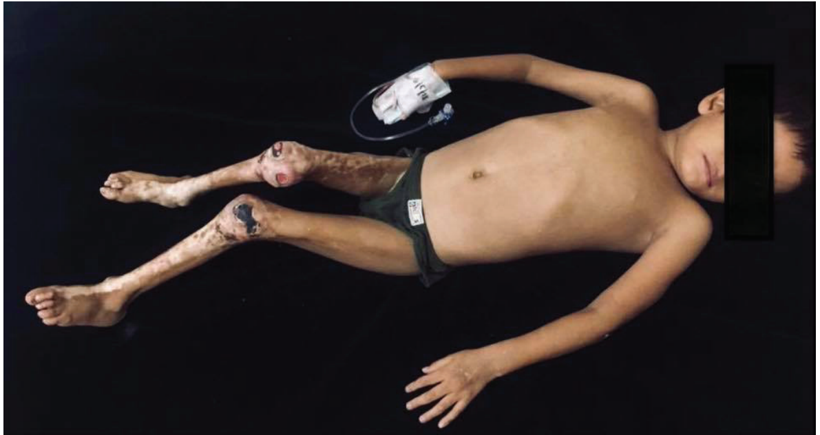
Figura 01: Varón de 5 años de edad, procedente de La Libertad, acude a consulta por pérdida de masa muscular progresiva y debilidad en miembros inferiores de 12 meses de evolución el 03 de mayo del 2018.