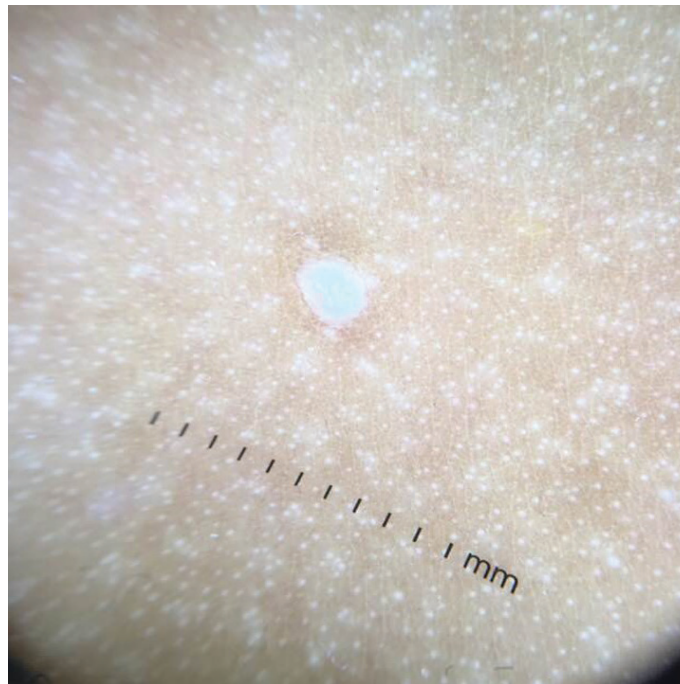
Figura 04: Dermatoscopia: Piel de tronco con máculas acrómicas puntiformes en patrón confeti