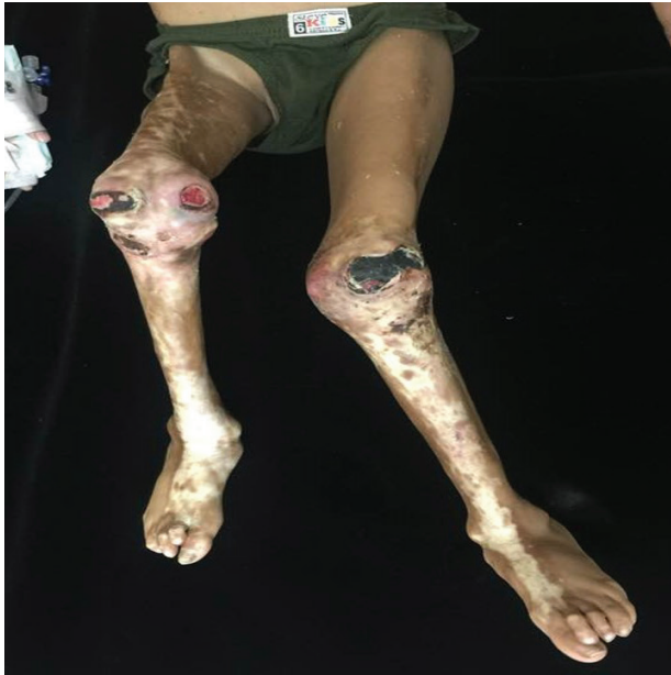
Figura 02: Al examen físico: Atrofia severa en miembros inferiores con postura de flexión permanente, úlceras extensas con costras hemáticas que comprometen ambas rodillas y placas induradas color marfil que se extienden desde el pie hasta la cadera en miembro inferior derecho y desde el pie hasta la rodilla en miembro inferior izquierdo.