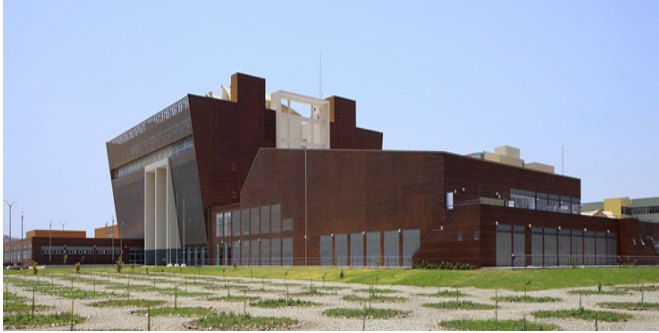
Figura 1: Vista externa del Hospital Regional Lambayeque

El Hospital Regional Lambayeque se ubica en la provincia de Chiclayo, Región Lambayeque en el Noroeste del Perú. Cuenta con un área de terreno de 48 921,62 m 2 , un área construida de 27 420 m 2 , con seis pisos de elevación (Figura 1). Fue construido con 178 camas de hospitalización, cinco salas de operaciones, dos salas de partos y 35 consultorios externos para atención especializada (Figura 2).