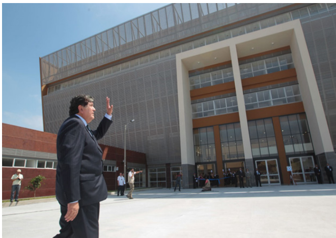
Figura 4: Inauguración del hospital por el presidente de la República del Perú.

El hospital es inaugurado el 9 de julio del 2011 por el entonces presidente de la república y el presidente regional (Figura 4). Este acto fue difundido por diversos medios de prensa (8) .