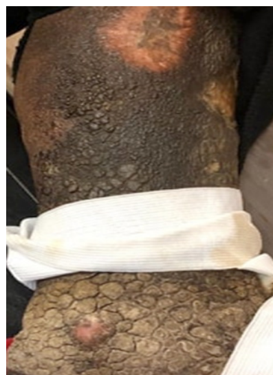
Figura 3. Lesiones queiloideas en miembro inferior izquierdo en paciente alcohólico crónico con posible lobomycosis.

Asimismo se visualiza edemas en ambos miembros inferiores (1+/4+). Presencia de cicatriz queiloide en miembro superior derecho de 17 cm x 1,8 cm (Figura 3). En el miembro inferior izquierdo es visible lesiones de evolución progresiva que actualmente muestran las siguientes características: elevaciones circunscritas, sólidas, múltiples de aspecto queiloide extendidas desde la pierna hasta el pie en su totalidad, dolorosas a la palpación y de coloración marrón-negrucza con variaciones de zonas hipo e hiperocrómicas, que coalescen para formar placas engrosadas de apariencia similar a tierra agrietada (Figura 3). Las lesiones presentan depresión reactiva.