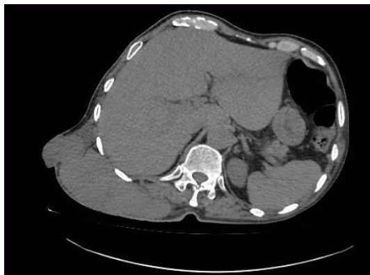
Figura 2: TC torácica con la masa de partes blandas en pared tórax derecho.

En la tomografía computarizada (TC), se aprecia masa heterogénea, localizada en partes blandas de la pared torácica derecha con extensión hacia pleura así como una invaginación en cavidad pleural. (Fig3, 4).