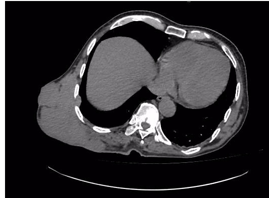
Figura 3: TC torácica tumor invade cavidad torácica y pleural.

El informe anatomopatológico, cuadro histopatológico compatible con tumor maligno de vaina nerviosa periférica con diferenciación rabiomioblastica, áreas pleomorficas y de células gigantes, necrosis extensa, alto índice mitótico con atipia, infiltración de tejido ose de costillas, infiltración vascular, dos de los bordes del tumor comprometidos.