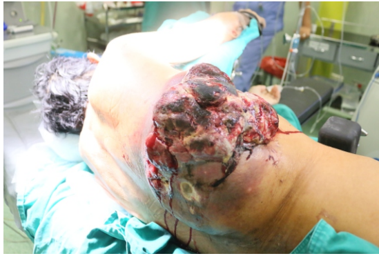
Figura 1: Tumor sangrante en tórax derecho con tejido necrótico.

tumor se infiltre e invada el pulmón derecho, además del constante sangrado que ocasionaba en el paciente (fig.2). Fue necesario retirar tres costillas, ya que el tumor había avanzado entre estos; por lo que luego se colocó una malla de polipropileno para cubrir la zona hueca a cargo del cirujano de tórax y cardiovascular; seguidamente, con la participación del cirujano plástico, se realizó múltiples colgajos para poder cubrir con piel la zona intervenida.